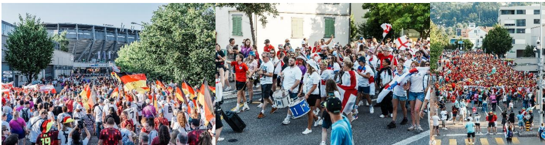
Bilder 7 – 9: Fan Walks zum Stadion

Der Austausch und die Zusammenarbeit mit den Fussballverbänden der in St.Gallen gastierenden Nationen verlief sehr positiv und erwies sich als wertvoll für beide Seiten. Die Host City St.Gallen unterstützte bei der Organisation von Fan Walks sowie Fan Matches, den Spielen unter den Fans vor der eigentlichen Partie am Abend. Dafür stand einmalig auch der Sportplatz im Innenhof der Buebeflade zur Verfügung. Der Klosterbezirk bot eine eindrucksvolle Kulisse, an der sich neben den Fans auch internationale Medienschaaffende erfreuten.