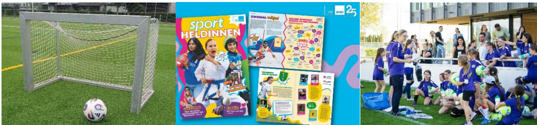
Bilder 13 – 15: Der Frauenfussball wurde auf mehreren Ebenen gezielt gefördert.

Im Bereich Inklusion und Bewegungsförderung unterstützte die Host City St.Gallen die Stiftungen Caritas und AKIN. Dadurch konnten armutsbetroffene Kinder sowie geflüchtete Frauen kostenlos an einem grossen gemeinschaftsfördernden Sportangebot teilnehmen. In Zusammenarbeit mit der UEFA besuchten zudem mehr als 200 sozial benachteiligte Kinder und Familien die Spiele der Frauen-EM in St.Gallen. Mit einem Inklusionsturnier in der Fan Zone konnte ein weiteres Zeichen gesetzt werden. Des Weiteren übernahm die Host City St.Gallen die Inbetriebnahme von drei BoxUp-Stationen zur kostenlosen Sportgeräte-Ausleihe im öffentlichen Raum. In den ersten fünf Monaten wurden bereits über 2'500 Nutzungen von Personen zwischen 11 und 92 Jahren registriert.