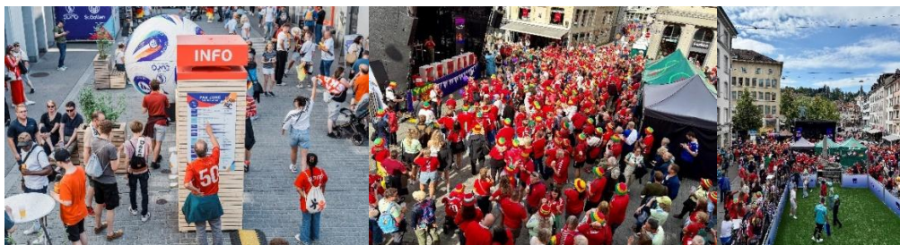
Bilder 4 – 6: Fan Zone Marktgasse

Die Ordnung und Sauberkeit in der Fan Zone waren durchgehend sehr gut. Dank gut eingespielter Abläufe und regelmässiger Kontrollen hinterliessen die Anlagen jederzeit einen gepflegten Eindruck. Zwischenfälle gab es keine. Die Sicherheit war stets gewährleistet. An Matchtagen wurde die Securitas zusätzlich von der Stadtpolizei unterstützt. Auch Vandalismus und Unwetter blieben aus. Das Wetter war bis auf zwei Tage durchwegs schön und warm, sodass weder kurzfristige Reparaturen noch Notfallmassnahmen notwendig waren.