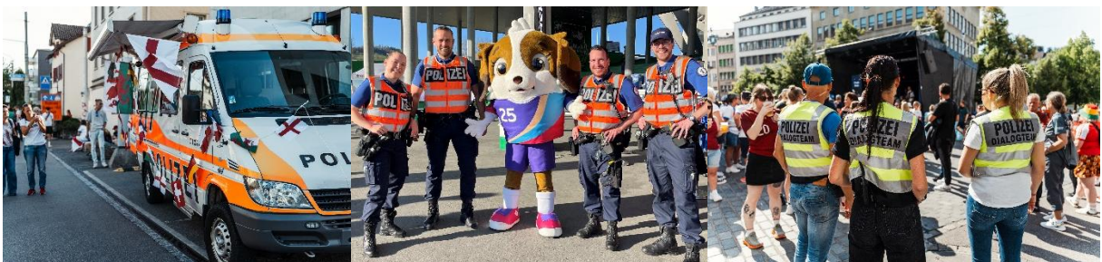
Bilder 1 – 3: Die Stadtpolizei unterstützte das friedliche Fussballfest

Die Stadtpolizei St.Gallen war mit ihren Partnern umfassend auf das Grossereignis vorbereitet. Durch den gezielten und angemessenen Einsatz der vorhandenen Mittel konnte die Sicherheit zu jeder Zeit gewährleistet werden. Die vorübergehenden Festnahmen von zwei Personen im Stadionperimeter darf im Verhältnis zum hohen Personenaufkommen als äusserst gering bezeichnet werden. Gleiches lässt sich auch aus medizinischer Sicht sagen, da lediglich eine Person ausserhalb des Stadions von der Sanität betreut werden musste. Stark betrunkene Personen, welche durch Sanität oder Polizei hätten betreut werden müssen, wurden nicht verzeichnet.