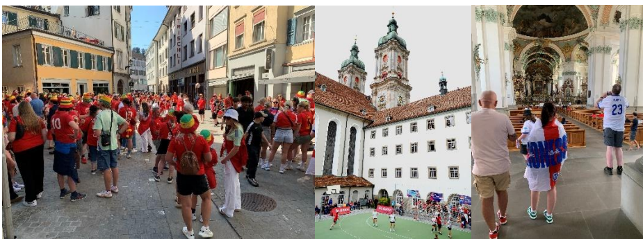
Bilder 10 – 12: Fans entdeckten die Stadt St.Gallen

Das Convention Team von St.Gallen-Bodensee Tourismus kümmerte sich um die Bearbeitung und Betreuung von Gruppenanfragen. Insgesamt fanden 18 unterschiedliche Veranstaltungen statt, darunter Fan Events, VIP-Essen und Workshops. Die Anfragen gingen insbesondere von Organisationen aus Wales sowie Deutschland und England ein.